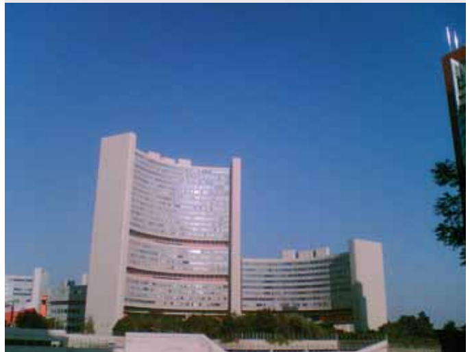
Det Internationale Atomagentskabs, IAEA's formål var og er at fremme den fredelige udnyttelse af atomkraften på verdensplan.