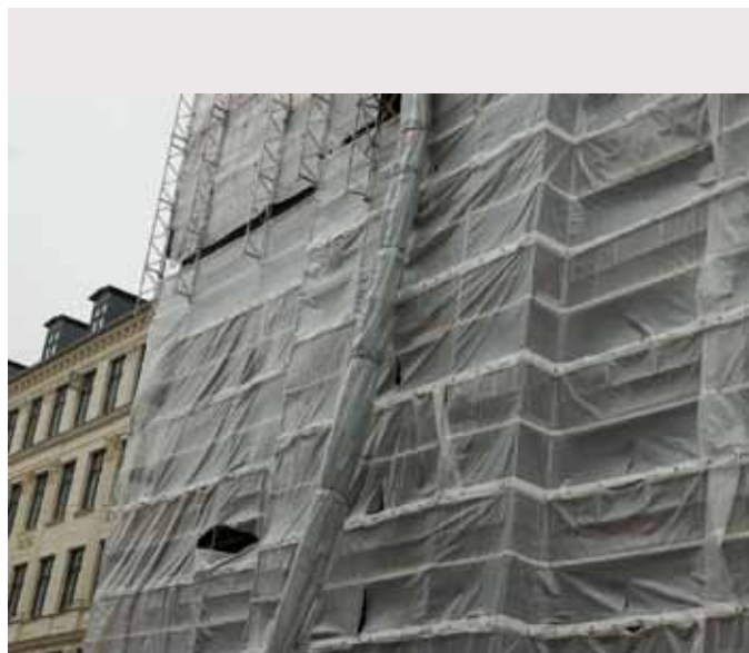
Energibesparelser giver langt mere CO 2 -reduktion for pengene end atomkraft.

Skal atomkraften "sælges" til et lands befolkning, skal den gøres sikker. Men al erfaring viser, at sikkerhed koster penge. Erfaringerne viser også, at hvis økonomien er presset, er sikkerheden det første, det går ud over.