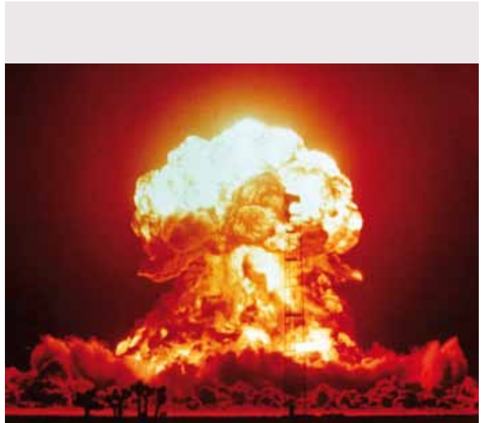
Efter 2. Verdenskrig havde specielt USA et stort behov for at vise, at atomets kraft også kunne udnyttes fredeligt.

EU støtter altså atomkraft både politisk og økonomisk, og atomkraft er den eneste teknologi, der har sin egen traktat. EU bruger lige så mange penge til forskning i atomkraft som til den samlede energi-