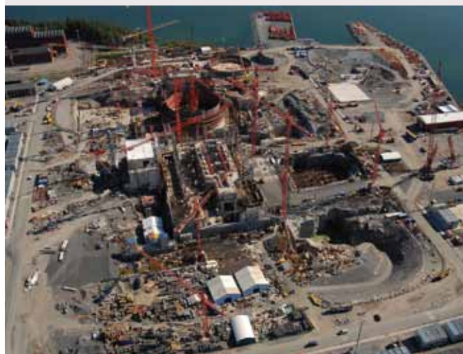
I Finland er man ved at bygge et nyt, stort atomkraftværk. Foreløbig ser det ud til at blive dobbelt så dyrt som beregnet. Hvem skal betale?

NOAH mener, at atomkraft er en dyr, dårlig og risikabel vej at slå ind på, når vi skal løse klimaproblemerne. Atomkraft vil samtidig hindre en decentral energiforsyning baseret på energieffektivisering og vedvarende energikilder.