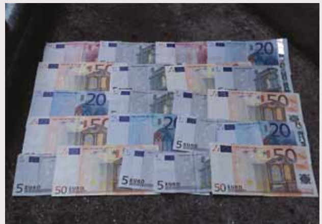
Danmark betaler stadig gennem EU til forskning og udvikling af atomkraft.