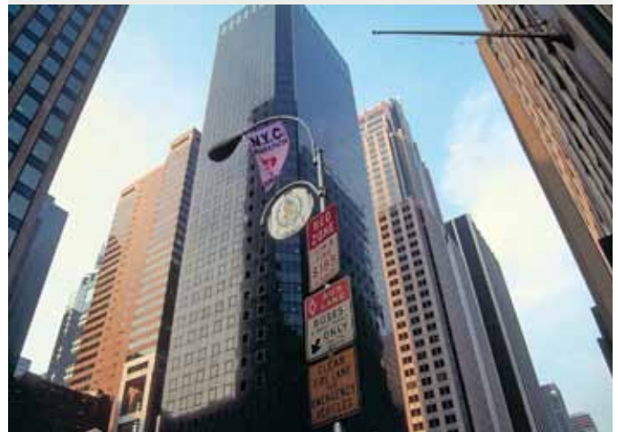
USA med 4,5 % af jordens befolkning har ansvaret for 29 % af de historiske udledninger, mens Kina med 20 % har ansvar for 9 % af udledningerne.